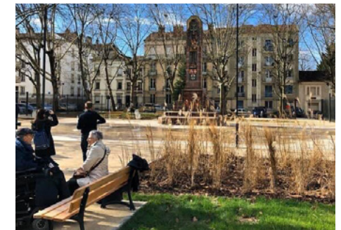
Réaménagement de la place de la Croix de Bourgogne - Juin 2019